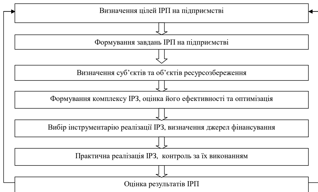
Рис. 2. Структурна схема організаційно-економічного механізму управління реалізацією ІРП на машинобудівному підприємстві

Можливості практичного застосування запропонованого механізму проілюстровано на прикладі досягнення конкретної управлінської мети (забезпечення оптимального рівня повної ресурсомісткості нового машинобудівного виробу) зі створенням тимчасової організаційної структури – робочої групи з фахівців різного профілю, функціонування якої забезпечує комплексний підхід до вирішення поставленої проблеми.