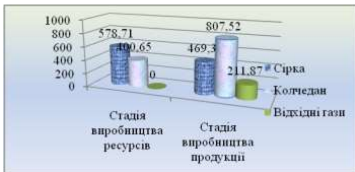
Рис. 2. Еколого-економічні втрати від виробництва сірчаної кислоти за стадіями ЖЦ

Необхідність проведення екологізації ЖЦ сірчаної кислоти обумовила розроблення комплексу науково-обґрунтованих рекомендацій щодо вибору напрямків екологізації виробництва сірчаної кислоти на ВАТ «Сумхімпром» на основі екологічного SWOT-аналізу продукції. Результати запропонованих напрямків екологізації (зменшення викидів сірчистого ангідриду за рахунок реконструкції контактного апарату та виробництво електроенергії з попутної продукції виробництва сірчаної кислоти – енергетичної пари) включають відвернені сукупльні еколого-економічні втрати у розмірі 14136 тис. грн та приріст економічних результатів підприємства у розмірі 81127 тис. грн у розрахунку на річний обсяг виробництва продукції.